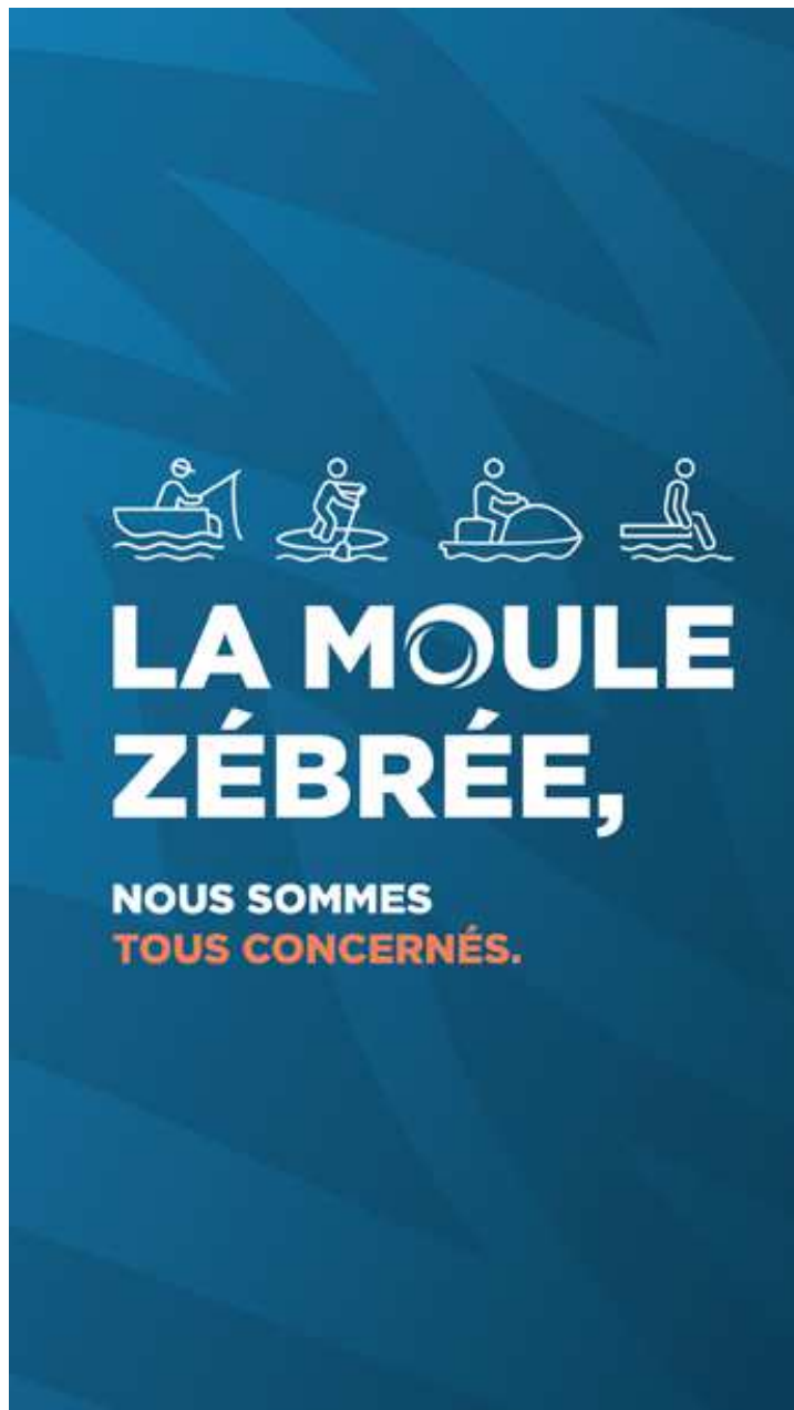
Josée Ouellet Mairesse

Au plaisir de vous accueillir au bureau municipal, et merci de nous soutenir dans la lutte contre les espèces envahissantes !